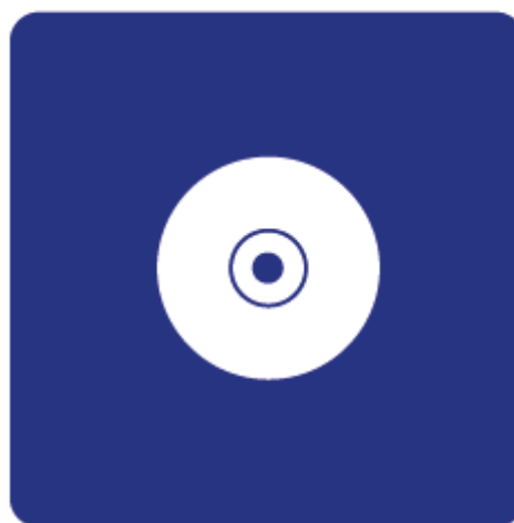
Положение диска на мате

Уход и хранение: протирать влажной салфеткой. хранить в пакете. Избегать прямого контакта с конвертами грампластинок.